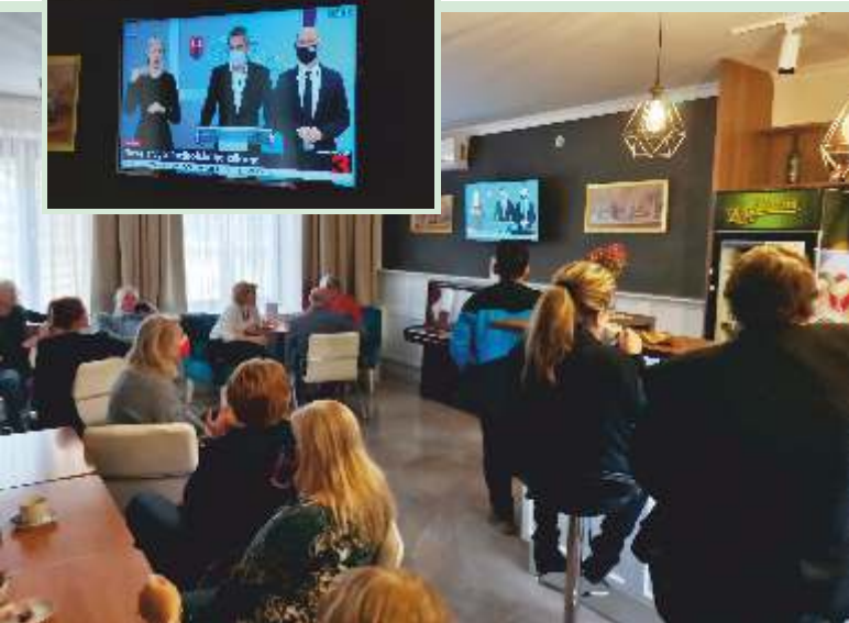
Delegáti pléna počas prestávky s napätím sledovali tlačovú besedu ministra školstva Branislava Grohlinga k novele zákona o vysokých školách