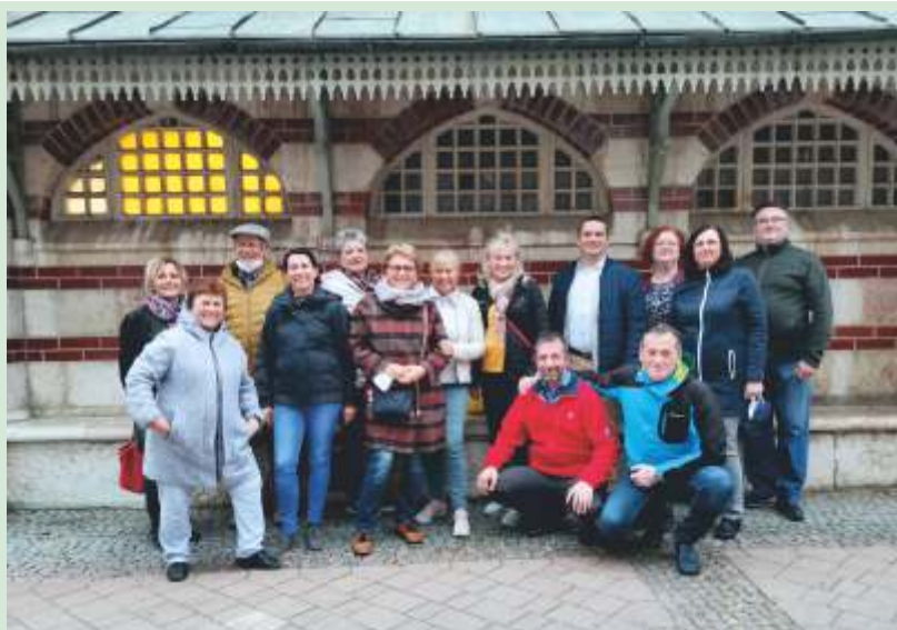
Viaceri členovia Združenia vysokých škôl a priamo riadených organizácií počas prestávky medzi rokovaniami obdivovali krásu a pamätihodnosť Trenčianskych Teplíc